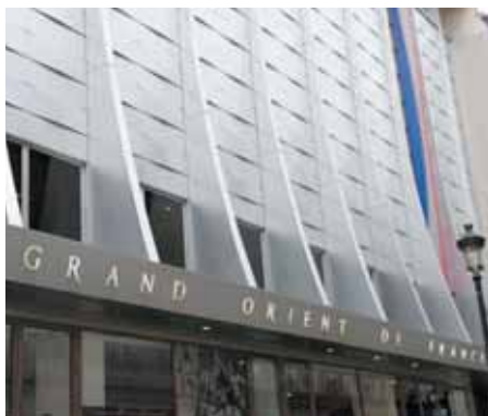
Siège du Grand Orient de France (16, rue Cadet - Paris 9)

«A la recherche d'un progrès qui profite à tous»